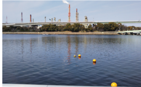
(画像 g) 危険ブイ 大阪府「豊かな大阪湾」環境改善モデル事業 浜寺公園側、沖合 5 m 付近までの海中に試験設備が設置されています。