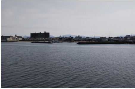
(画像 e) 高石漁港 漕艇センター側からの画像